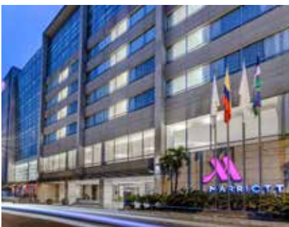
Hotel Marriott - Cali www.marriott.com/es/hotels/clomc-cali-marriott-hotel/overview/

Tarifas: Deluxe King COP $290.042 / por noche (No incluido impuesto IVA del 19%). USD $80/ per night