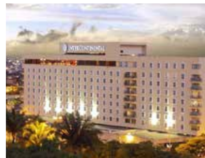
Hotel Estelar S.A. - Cali www.hotelesestelar.com/destinos-estelar/colombia/cali/intercontinental/

Tarifas: Deluxe Guest room, 1 King COP $682.000 /por noche (No incluido impuesto IVA del 19%). USD $186 / per night