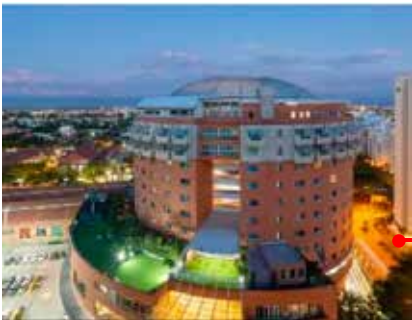
Hotel SPIWAK - Cali www.spiwak.com/es/

Se sugiere reservar con meses de antelación el hotel, teniendo en cuenta la disponibilidad y ocupación hotelera por el evento cultural Petronio Álvarez, celebrado en la ciudad de cali para la misma fecha de la asamblea