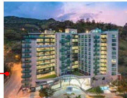
Hotel SPIRITO by SPIWAK - Cali www.spiwak.com/es/

Tarifas: Deluxe King COP $290.042 / por noche (No incluido impuesto IVA del 19%). USD $80/ per night